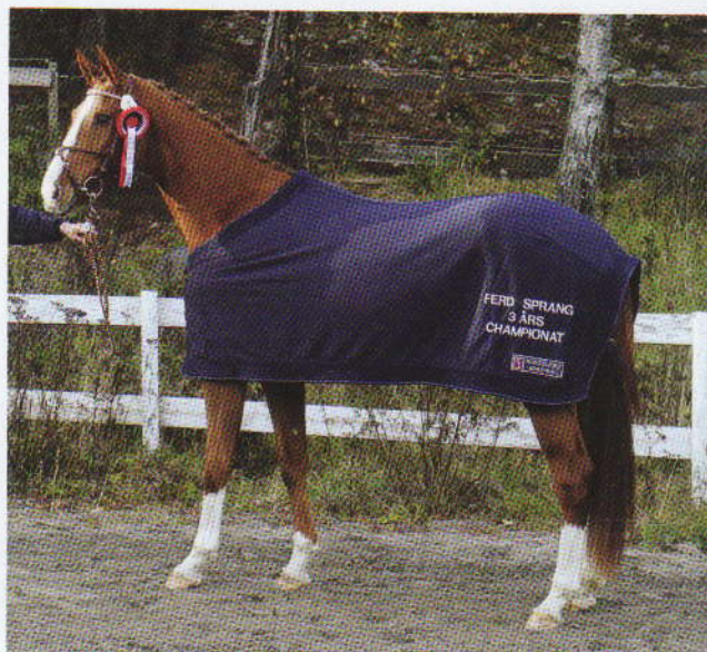
○ I 3-års championatet var det Engas Ramada e. Ulrich Z/Rafaelli Z fra Kady Bessberg som var best av spranghestene.

I klassen for 5-åringer og eldre varmblodshopper var det 10 hopper som deltok. Fem av dem ble kåret i hovedstamboken. Beste hoppe ble Flin Flon e. Faschingprinz/Samber fra Lillian Strand. Hun er en hoppe av særdeles god type, med en smidig overlinje og særdeles god bevegelse i trav og galopp og en taktfast bevegelse i skritt. Hun deltok også i løshoppingen hvor hun demonstrerte meget stor sprangkapasitet med fremragende teknikk.